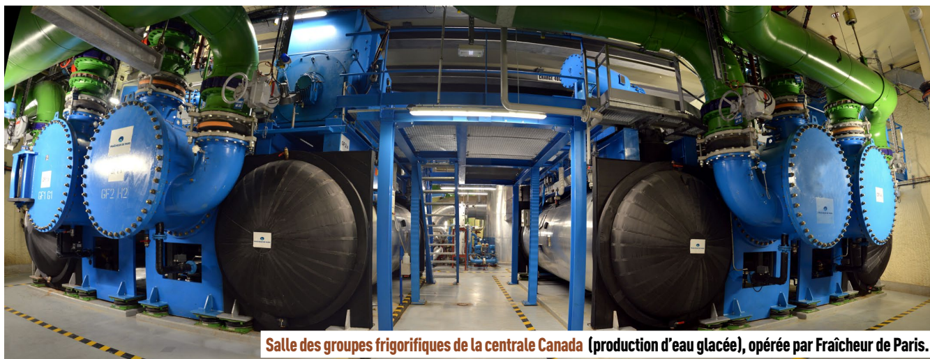
Salle des groupes frigorifiques de la centrale Canada (production d'eau glacée), opérée par Fraîcheur de Paris.

Chargé de produire du froid dans la capitale, Fraîcheur de Paris ambitionne de tripler son activité d'ici 2042. Mission impossible sans de nouveaux outils de pilotage. C'est pourquoi l'entreprise, concessionnaire de la Ville de Paris, a choisi d'implémenter le logiciel Carl, outil chargé de l'accompagner dans sa croissance et de l'impact sur les métiers de la maintenance.